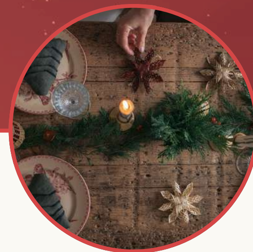
Table de Noel